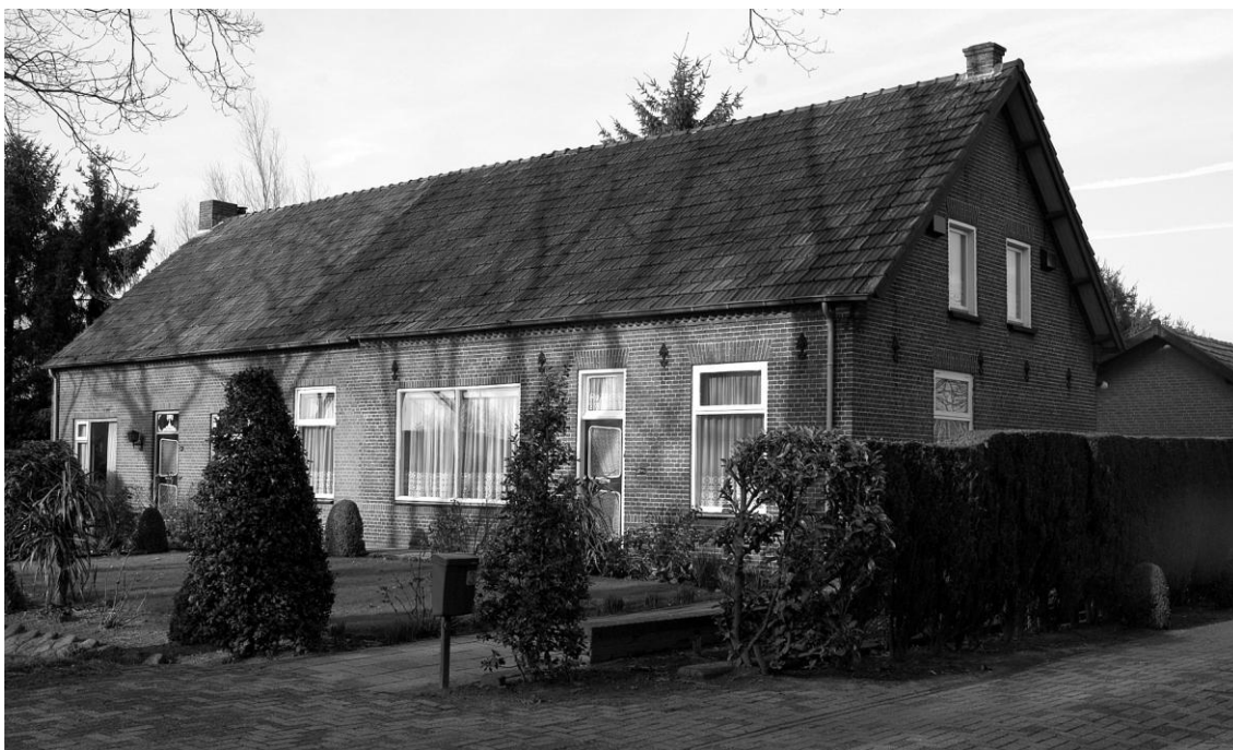
De huidige boerderij. In haar korte geschiedenis hebben er een groot aantal mensen gewoond.