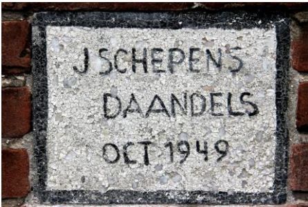
Hierboven de gevelsteen uit 1949.