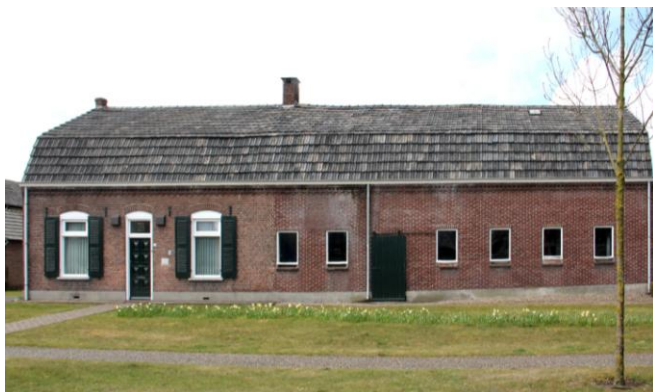
De huidige boerderij in 2013