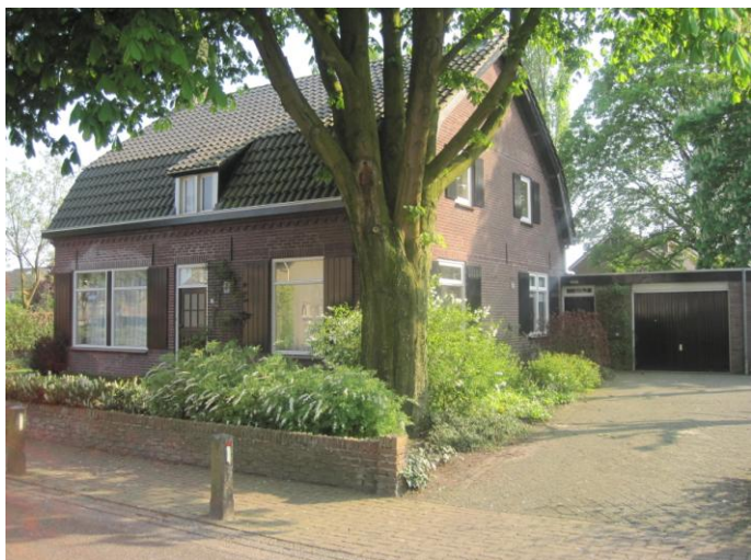
Het huidige huis in de Ericastraat.