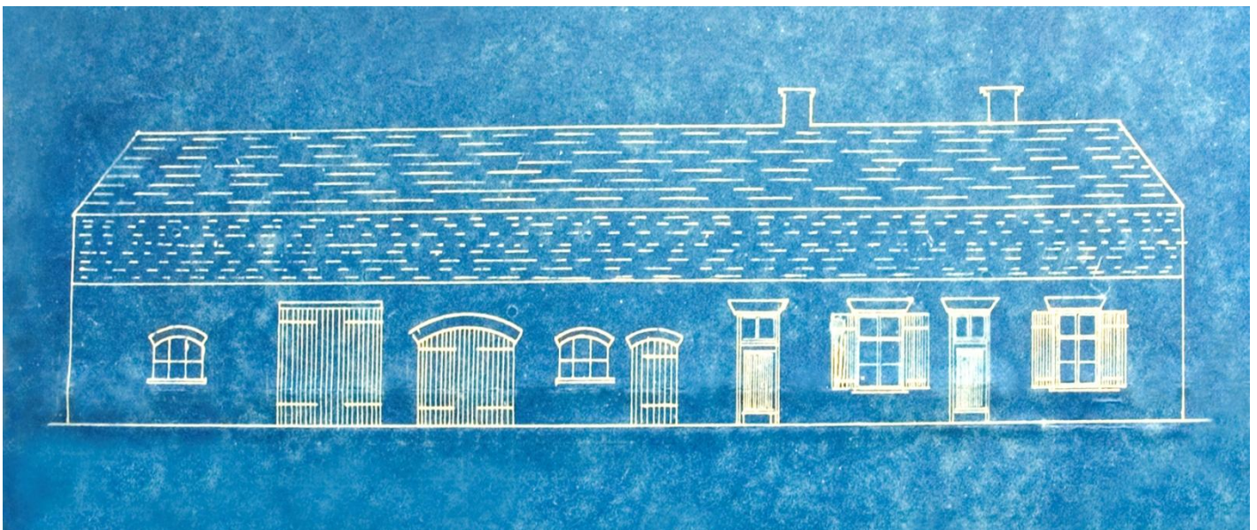
Hier boven de bouwtekening welke behoorde bij de bouwaanvraag in 1926.

In 1926 heeft Willem Kemps (Rutten) de oude boerderij afgebroken en de huidige boerderij gebouwd.